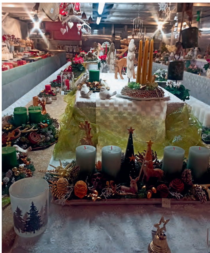
Vánoční atmosféru v naší městské části opět zvýraznili naši zahradníci...